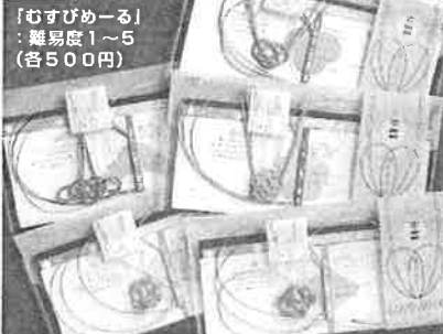
「むすびめる」 ：難易度1～5 (各500円)